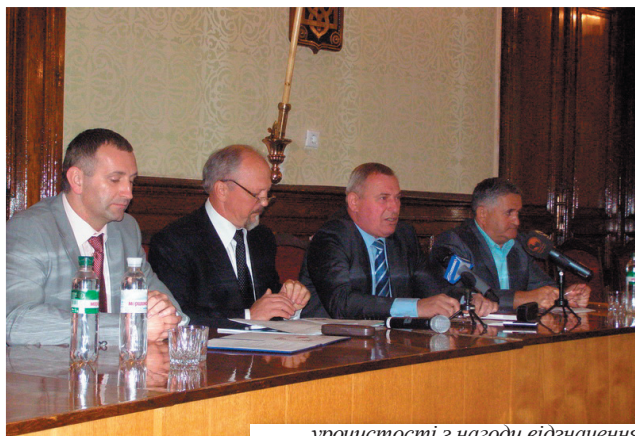
урочистості з нагоди відзначення 15-ої річниці з дня заснування Центру