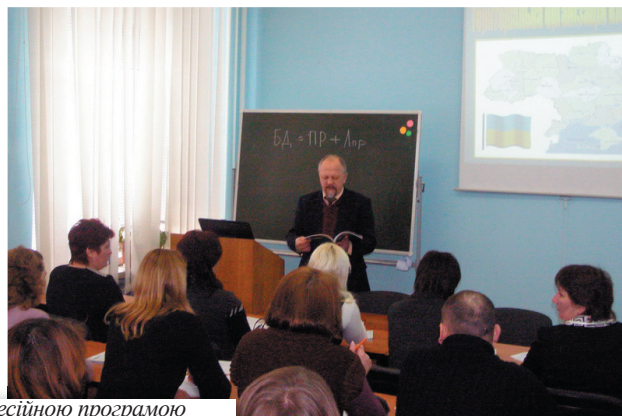
навчання за Професійною програмою

популярністю користуються такі постійно діючі семінари як: «Культура ділового мовлення та психологія спілкування», «Європейська та євроатлантична інтеграція України», «Англійська мова» (розмовний курс), «Запобігання та протидія проявам корупції у сфері управління», «Застосування інформаційних технологій в системі державної служби», «Позитивний імідж державного службовця».