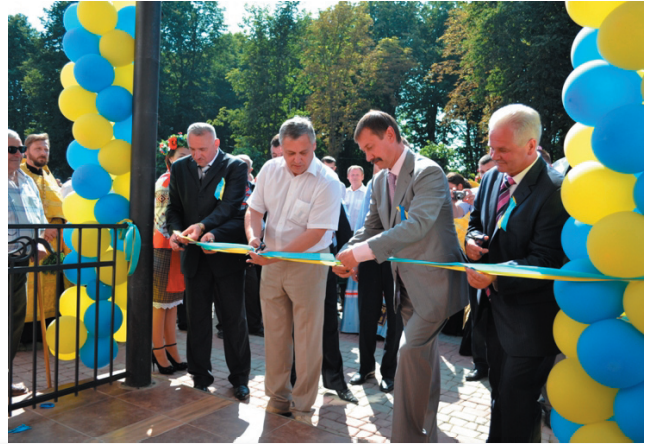
В ювілейний день народження України, в селі Молодія на Глибоччині голова Чернівецької облдержадміністрації Михайло Папієв разом з учнями, педагогами і громадою села урочисто відкрили нову школу

країни – це створення умов для економічної свободи вітчизняного товаровиробника”.