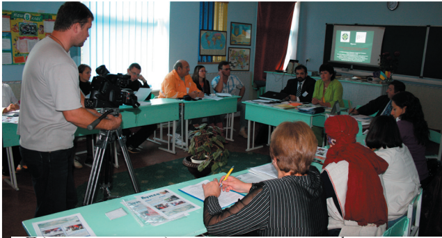
Під час реалізації одного з проектів за співфінансуванням Німецького Товариства Технічного Співробітництва