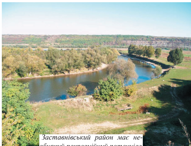
Заставнівський район має неабиякий рекреаційний потенціал

оцінки соціально-економічного розвитку районів, міст області.