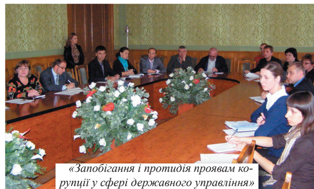
«Запобігання і протидія проявам корупції у сфері державного управління»

корупції у структурних підрозділах обласної державної адміністрації, територіальних підрозділах центральних органів виконавчої влади в Чернівецькій області.