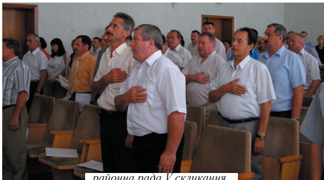
районна рада V скликання

ною підготовкою, активною громадською позицією, хоча депутатському корпусу випало працювати в умовах як політичної, так і економічної нестабільності в державі. Сьогодні, можна впевнено констатувати: районна рада відбулася, вона працює як цілісний системний механізм. Депутати, виконавчий апарат районної ради, незважаючи на недосконалість чинного законодавства, розв'язуючи нагальні проблеми, що турбують жителів району, розробляючи цільові Програми, що визначають основні напрямки подальшо-