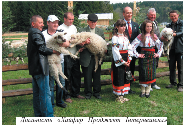
Діяльність «Хайфер Проджект Інтернешенл» спрямована на підвищення життєвого рівня селян

Успішним прикладом продуктивної співпраці громади і влади є реалізація проєктів у Сторожинецькому районі: «Допомога сільським родинам Буковини у розвитку особистих селянських господарств 2007 - 2011р.р.», «Допомога сільським родинам Буковини, які постраждали від повені у Західній Україні у відновленні особистих селянських господарств», які започатковані