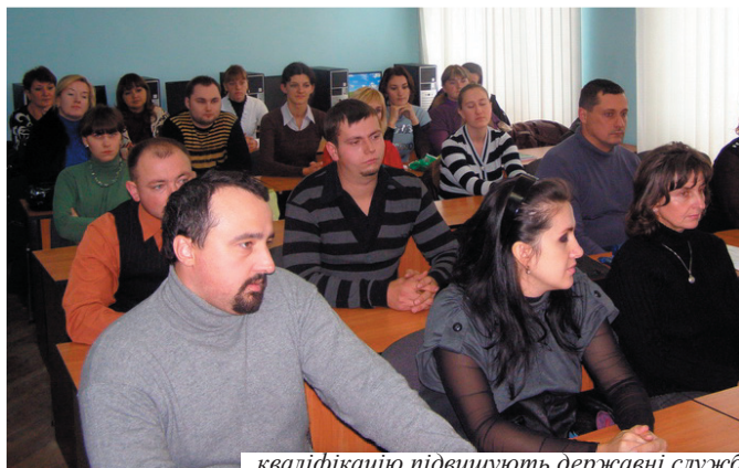
кваліфікацію підвищують державні службовці, які працюють на посаді до 1 року