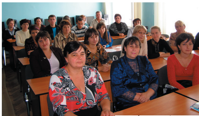
кваліфікацію підвищують бухгалтери сільських рад

28 вересня 2010 року розпочалося навчання за програмою постійно діючого семінару «Запобігання і протидія проявам корупції у сфері державного управління» для посадових осіб, відповідальних за попередження проявів