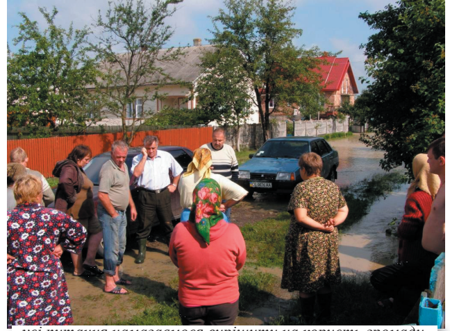
усі питання намагаємося вирішити на користь громади

місцевості, розширення мережі додаткових груп перебування дітей, покращення якості надання послуг з дошкільної освіти, оновлення матеріально-технічного оснащення, що, переважно, можна віднести і до всіх за-