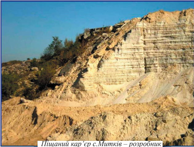
Піщаний кар'єр с.Митків – розробник ТОВ "Новий розроблювач"

ставна, відкриття якого планово відбудеться в другій половині жовтня цього року.