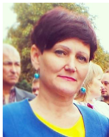
Інтерв'ю вела Майя Калін, член Національної спілки журналістів України

приймають зважено. Але ми вже маємо певні напрацювання. Принагідно закликаю всіх до співпраці. Сподіваюся, що проблемні питання будуть спільно врегульовані, і це дасть нам можливість динамічніше розвиватися і сповна використовувати внутрішні резерви в інтересах жителів нашого району. І такі резерви ми маємо. Ми відкриті до діалогу та спільної роботи.