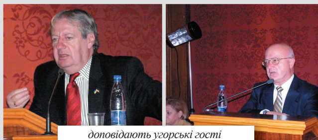
доповідають угорські гості

26 березня 2010 року Центром євроатлантичної інтеграції та безпеки Чернівецького національного університету ім. Ю.Федьковича та Чернівецьким регіональним центром перепідготовки та підвищення кваліфікації працівників органів державної влади, органів місцевого самоврядування, державних підприємств, установ та організацій було проведено міжнародний науково-практичний семінар «Європейська та євроатлантична інтеграція країн Вишеграду: досвід для України».