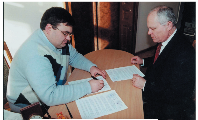
Підписання плану спільних заходів

Новою угодою про співробітництво між Головдержслужбою України, Чернівецькою обласною державною адміністрацією та Чернівецькою обласною радою на 2010 рік, зокрема, передбачається проведення наради з питань попередження проявів корупції у місцевих державних адміністраціях та територіальних підрозділах центральних органів виконавчої влади України, організація семінару-навчання для працівників кадрових служб органів виконавчої влади та органів місцевого самоврядування з питань здійснення моніторингу працевлаштування магістрів за спеціальностями галузі знань "Державне управління" тощо.