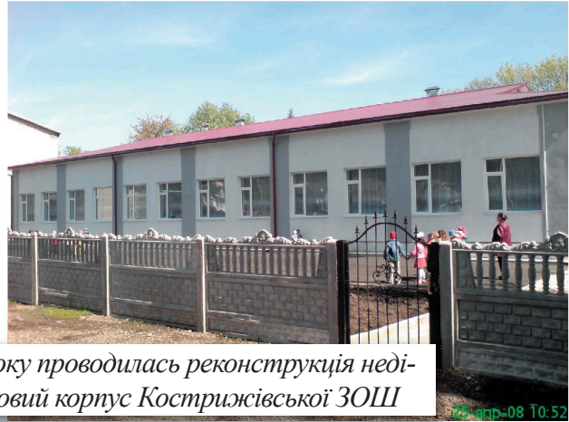
Із грудня 2006 року по січень 2008 року проводилась реконструкція недіючого приміщення універмагу під новий корпус Кострижівської ЗОШ

чанням, вивозом побутового сміття та облаштуванням нормальних доріг. У 2001 році в смт. Кострижівка ми створили Управління житлово-комунального господарства не тому, що ми так захотіли, а тому, що відповідно до Указу Президента України два вищезгаданих промислових підприємства звалити на Кострижівську селищну раду весь соцкультпобут: 314 квартир, селищний клуб, стадіон, всі мережі водопостачання та водовідведення.