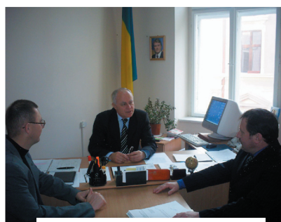
Особистий прийом громадян

Надання допомоги сприяло покращенню організаційно-кадрової роботи у зазначених державних органах, зокрема в частині планування роботи, контролю, проведення апаратних нарад, ведення особових справ, трудових книжок тощо, попередження проявів корупції, а також ефективному впровадженню в роботу кадрових служб локальної системи “Картка” єдиної державної комп'ютерної системи “Кадри”.