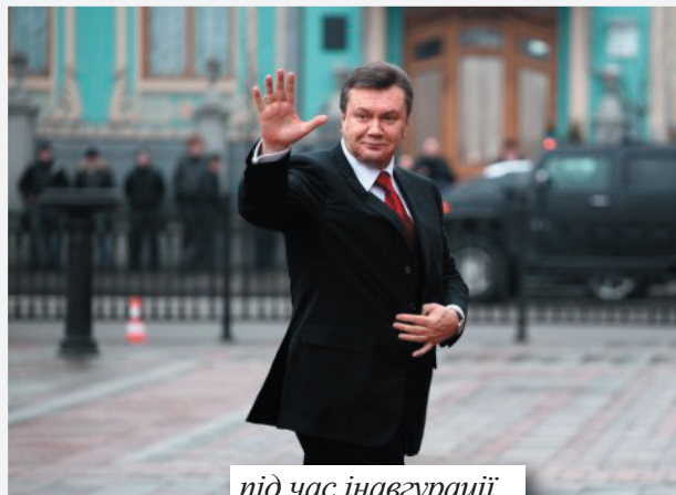
під час інавгурації

Усього в голосуванні взяли участь 68,8%, або 25 493 529 виборців.